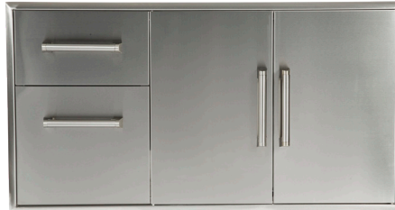
CCD-2DC 45" COMBO PORTES/TIROIRS