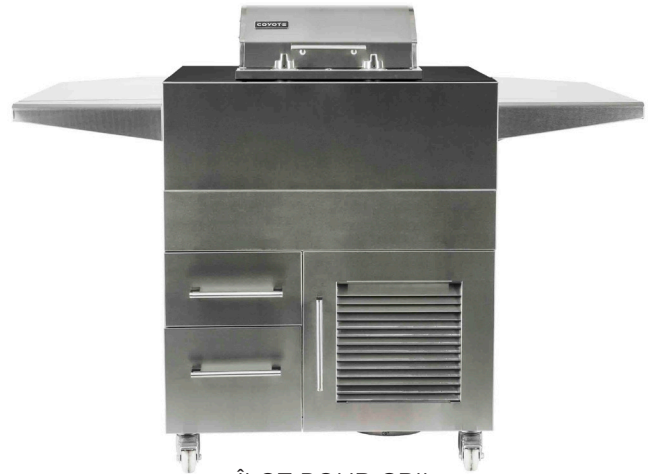
ÎLOT POUR GRIL ÉLECTRIQUE