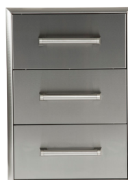
C3DC CABINET 3 TIROIRS L 17"