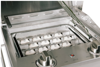
PLATEAU À BRIQUETTES AVEC ÉLÉMENT