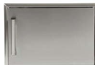
CSA1420 PORTE SIMPLE 14"X20"