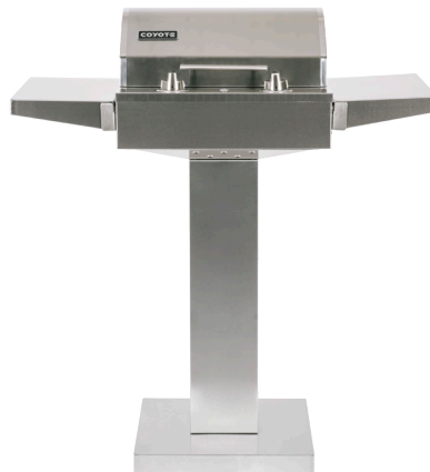
CHARIOT SUR PIÉDESTAL