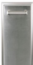
CSTC PORTE-TIROIR SIMPLE 14" POUR POUBELLE/RECYCLAGE