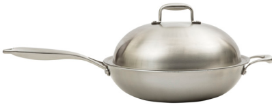
CWOK - CASSEROLE WOK