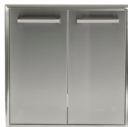
CTC PORTES-TIROIR DOUBLE 27" POUR POUBELLE/RECYCLAGE