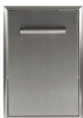
CPOD PORTE-TIROIR pour bonbonne de propane standard