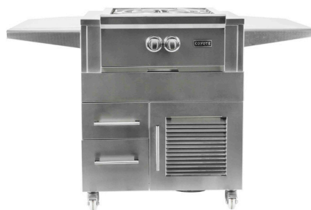
C2UNCT avec BRÛLEUR PUISSANT