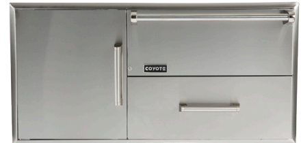
CCD-WD 42" COMBO AVEC TIROIR CHAUFFE-PLAT - Élément de chauffage électrique (400W) - Plage de température de 90° F à 250° F