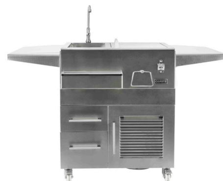
C2UNCT avec CENTRE DE RAFRAÎCHISSEMENTS