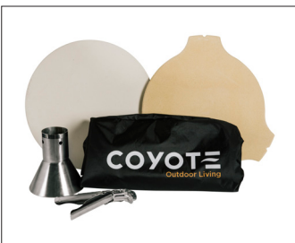
ASADO-ACC Ensemble d'accessoires