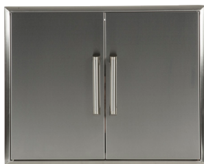
CDA2431 PORTE DOUBLE 24" X 31"