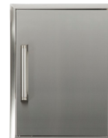
CSA2014 PORTE SIMPLE 20"X14"