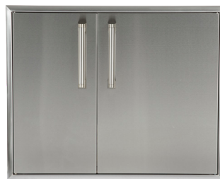
CDPC31 GARDE-MANGER AVEC TIROIRS 31"