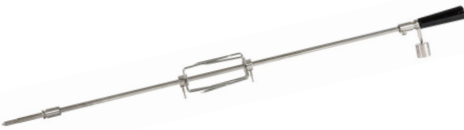
CROT - ENSEMBLE DE RÔTISSERIE