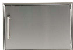
CSA1724 PORTE SIMPLE 17"X24"

Toutes les portes d'accès sont fabriquées en acier inoxydable rigide de première qualité (304) avec une bordure biseautée et des poignées professionnelles.