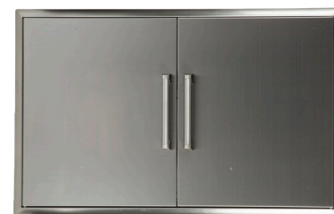
CDA2439 PORTE DOUBLE 24" X 39"