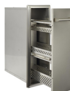
CSPRK TIROIR À ÉPICE