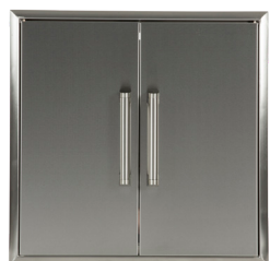
CDA2426 PORTE DOUBLE 24"X26"