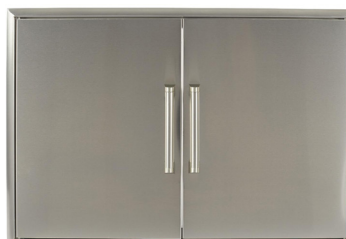
CDA2436 PORTE DOUBLE 24" X 36"