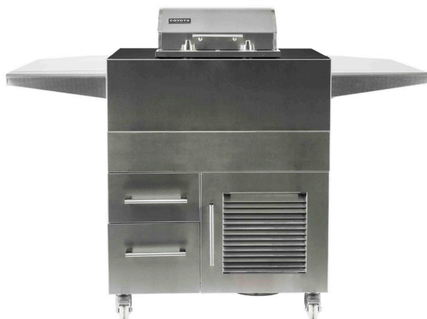
ÎLOT POUR GRIL ÉLECTRIQUE