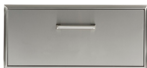
CSSD28 Tiroir de rangement unique de 28" CSSD36 Tiroir de rangement unique de 36"