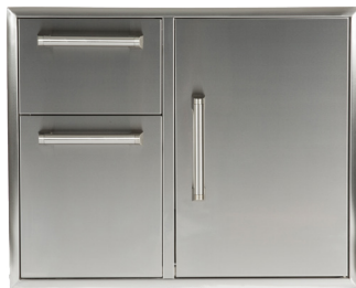
CCD-2DC31 31" COMBO PORTES/TIROIRS