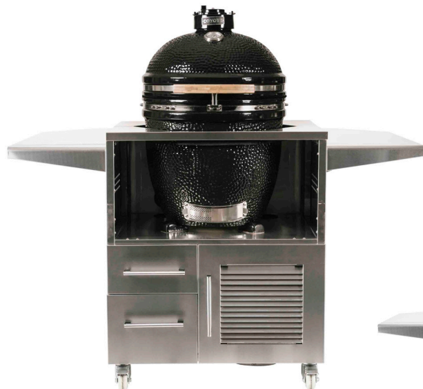
C2UNCT avec ASADO