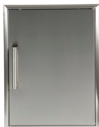
CSA2417 PORTE SIMPLE 24"X17"