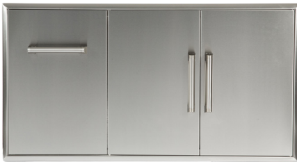
CCD-POD 45" COMBO PORTES/TIROIR

Tous les cabinets sont fabriqués en acier inoxydable rigide de première qualité (304) avec une bordure biseautée et des poignées professionnelles. Tous les tiroirs s'ouvrent et se ferment facilement sur roulettes.