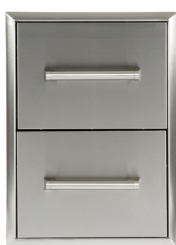
C2DC CABINET 2 TIROIRS L 14"